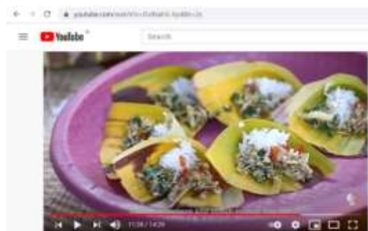
Gambar 4.11 Video Youtube channel Poticakitchen yang membahas gastronomi makanan

Penulis sebagai Pemimpin redaksi menggunakan konsep gastronomi makanan sebagai gagasan ide dari pembuatan karya Poticakitchen.com. Untuk menerapkan konsep gastronomi, penulis menggunakan media Youtube untuk mendukung kekuatan konten yang terdapat dalam situs Poticakitchen.com. Seperti gambar 4.12, penulis mempublikasikan konten video tentang “Filosofi kuliner khas Bali”. Dalam video “Filosofi kuliner khas Bali” menceritakan filosofi dari makanan yang berhubungan dengan ilmu seni pengolahan makanan yaitu gastronomi sehingga menjadi budaya yang dihasilkan.