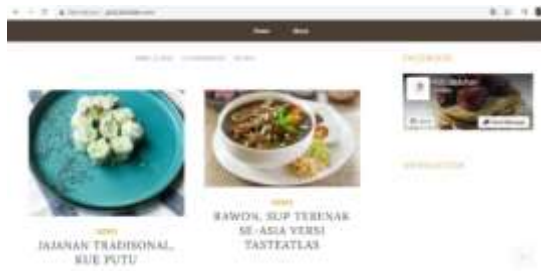
Gambar 4.2 Kanal Berita Poticakitchen.com