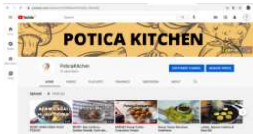
Gambar 4.10 Tampilan Youtube Poticakitchen.com