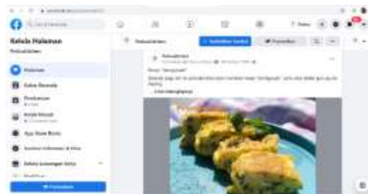
Gambar 4.8 Tampilan Facebook Poticakitchen.com

Media sosial ini memiliki nama @poticakitchen, bertujuan untuk menyebarkan informasi secara luas dan khalayak dapat terhubung pada website Poticakitchen.com.