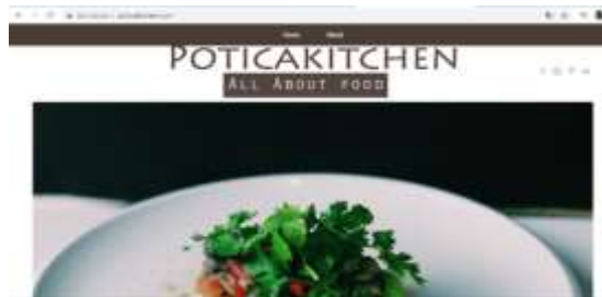
Gambar 4.1 Bagian depan website Poticakitchen.com

Home page adalah bagian awal website secara keseluruhan untuk menarik perhatian saat pembaca berkunjung pertama kali. Pada home page website Poticakitchen.com menyajikan foto dan informasi terbaru terkait lifestyle kuliner.