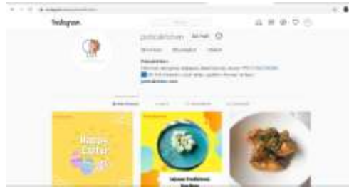
Gambar 4.7 Tampilan Instagram Poticakitchen.com