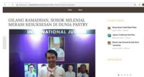
Gambar 4.6 Kanal Human Interest Poticakitchen.com

Memberikan informasi mengenai kisah sukses seseorang yang terjun di dunia kuliner yaitu seorang koki ( chef ) dan pebisnis kuliner. Bertujuan untuk memberikan semangat dalam diri masyarakat agar termotivasi serta semangat.