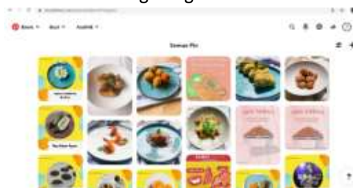
Gambar 4.9 Tampilan Pinterest Poticakitchen.com

Pada sosial media ini memiliki nama @poticakitchen. Menggunakan pinterest bertujuan agar khalayak dapat melihat karya fotografi yang disajikan pada poticakitchen.com dan khakaya juga dapat melihat berbagai informasi yang disampaikan karena terhubung dengan website Poticakitchen.com.