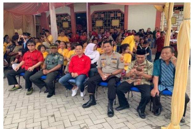
Gambar 4.4 Politisi Dewan Pimpinan Cabang PDI Perjuangan kota Tangerang dalam Menghadiri Undangan ke Agamaan

Sumber: Wawancara via Whatsapp pada tanggal 01 Juli 2020 13