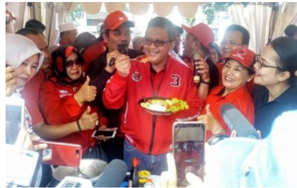
Gambar 4.8 Politisi Dewan Pimpinan Cabang PDI Perjuangan kota Tangerang Saat Melakukan Lomba Memasak Nasi Goreng Resep Ibu Megawati.

Selain memberikan pendampingan dan akomodasi, politisi Dewan Pimpinan Cabang PDI Perjuangan kota Tangerang memiliki beberapa kegiatan promosi untuk mengajak semua unsur elemen masyarakat kota Tangerang dari tingkat pemuda, pemudi, dan orang tua semua untuk berkumpul sambil bersilaturahmi dan memperkenalkan Dewan Pimpinan Cabang PDI Perjuangan kota Tangerang kepada masyarakat dan juga memperkenalkan sosok bu Megawati.