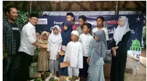
Gambar 4.3 Santunan Anak Yatim Piatu yang Menunjukkan Politisi Dewan Pimpinan Cabang PDI Perjuangan kota Tangerang adalah Partai Wong Cilik

seluruh daerah termasuk kota Tangerang dengan masyarakat tetap terjalin. Masyarakat kota Tangerang dapat menyampaikan segala keluh-kesahnya secara langsung mau pun online kepada Dewan Pimpinan Cabang PDI Perjuangan kota Tangerang namun disarankan mendatangi Ruang Rakyat agar komunikasi berlangsung interaktif.