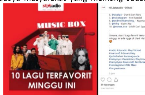
Feed Instagram Star Radio (Music Box)

Mengaitkan dengan penelitian ini, Star Radio juga melihat adanya pergeseran budaya masyarakat yang memang sudah