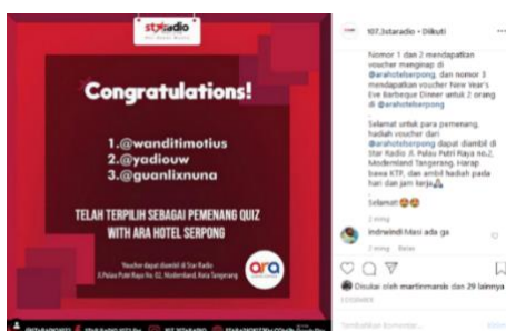
Feed Instagram Star Radio (Pemenang Quiz)

Membangun hubungan dengan audience dirasa sangat penting untuk mempertahankan eksistensi sebuah media, apalagi media lawas yang sudah banyak ditinggalkan oleh pendengar nya yang kini banyak beralih ke new media .